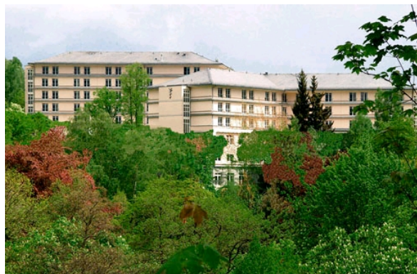
Klinik am Schillergarten